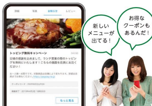
ユーザーは「お知らせ」から閲覧

ストアページには、店舗の最新情報やクーポンなどを掲載可能です。掲載された内容は、PayPay アプリのストアページ内にある「お知らせ」に表示され、ユーザーが閲覧できます。投稿内容は、審査完了後すぐに反映されるため、従来のチラシや雑誌への掲載に比べ即時性のある集客が期待できます。