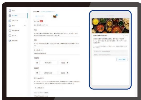
加盟店が情報を入力