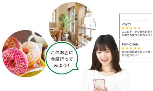
ユーザーが感想を投稿