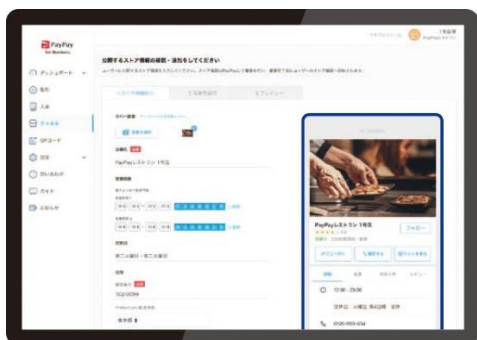
加盟店がストアページを開設