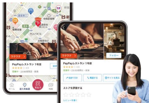
ユーザーは PayPay アプリで閲覧

「PayPay for Business」で店舗情報の照会が可能な「ストアページ」を開設できます。ストアページには、住所や電話番号、営業時間などの基本情報はもちろん、店舗の内観、外観やメニューなどの写真も簡単にアップロードできます。ストアページは、PayPay アプリ内でユーザーが閲覧できるため、お店選びをするユーザーへ店舗の魅力を発信できます。